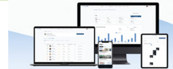
Die Plattform ist über die üblichen digitalen Geräte erreichbar.

Ihre Wohnung ist nur wenige Klicks entfernt. Sie gelangen über die Startseite unserer Homepage direkt auf die Registrierungsseite und können dort Ihr Wohnungsgesuch anlegen.