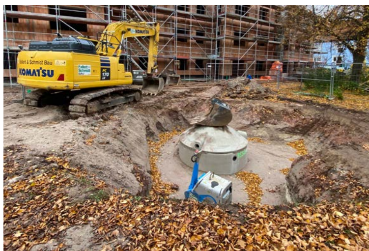
Das Bild zeigt den Revisionsschacht der Zisterne in der „Eckarts-Anlage“. Im Hintergrund der Rohbau Erich-Klabunde-Straße 1–3.

Das Herzstück des Neubaus bildet ein KfW-55-Standardhaus, das durch seine energieeffiziente Bauweise einen geringen Energieverbrauch gewährleistet. Die Wände des Gebäudes werden aus klimaneutralen Schlagmann Pro-