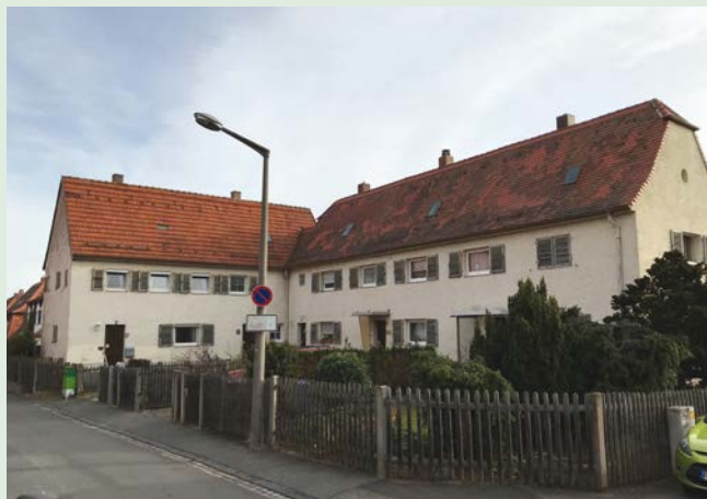
Weinbergstraße 20 – 28 vor Modernisierung

Auch 2019 investierten wir viel Geld in die Erhaltung und Entwicklung unseres Bestandes. Die Investitionen flossen in Neubau, Modernisierung und Instandhaltung. Hier ein Überblick der größten Einzelprojekte: