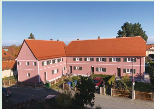
Weinbergstraße 20 – 28 nach Modernisierung